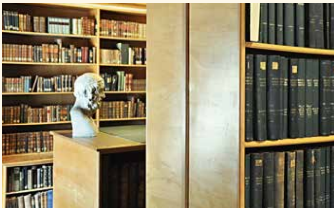
Verbesserung der Ausstattung mit Fachliteratur /Lexika