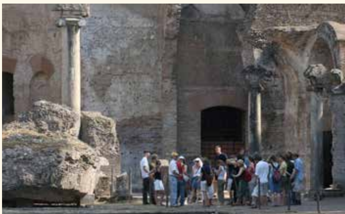
Kostenzuschüsse für Schulfahrten