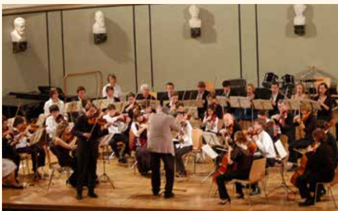
Anschaffung von Musikinstrumenten